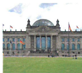
Platz der Republik